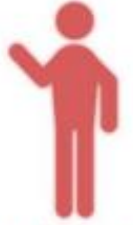
ผู้ยื่นขอเบิก

-เจ้าหน้าที่ตำรวจในสังกัด ยื่นความประสงค์ขอเบิก พัสดู โดยกรอกข้อมูลตาม แบบฟอร์มที่กำหนด ยื่นกับ เจ้าหน้าที่พัสดู