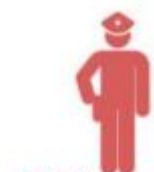
ผู้กำกับการสถานี (ผู้แต่งตั้ง)