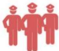
คณะกรรมการตรวจสอบ พัสดุประจำปี

เสนอผลการตรวจสอบ ภายใน 30 วัน นับตั้งแต่วันที่เริ่มตรวจสอบ